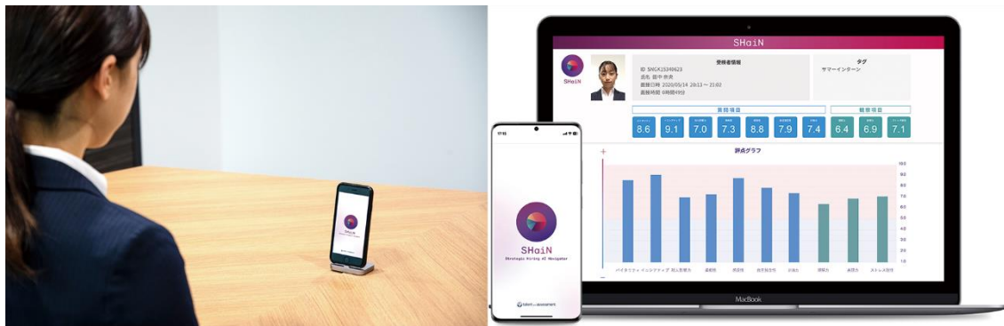
スマートフォンによる対話型 AI 面接サービス SHaiN の利用イメージ

タレントアンドアセスメントは、独自に開発した戦略採用メソッドをもとに、人間の代わりに AI が面接を実施することで、人間が行う面接で課題視されてきた評価のばらつきを改善し、採用基準の統一、先入観のない公平公正な選考を実現することを目指しています。