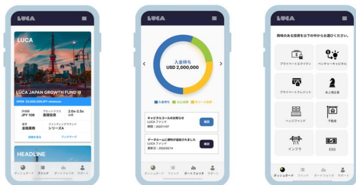
スマートフォン利用時のイメージ図

オルタナティブ投資の複雑な投資プロセスをワンストップで完結できるプラットフォームを通して、透明性の高い情報を適切に投資家に供給すると共に、投資工程をデジタルで効率化し、モニタリング活動までを一貫して行う仕組みで、適切な手数料率での商品の選定・供給を行う予定です。