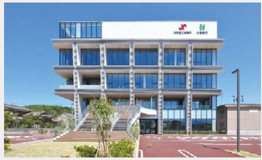
加賀営業部(2023年5月オープン)