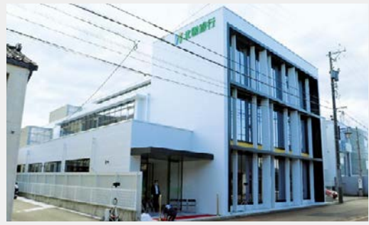
小松営業部(2022年8月オープン)